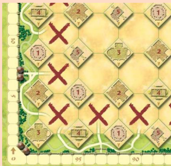
Az X-elt helyekre tilos tennie a kezdő játékosnak.

A Kezdő játékos nem teheti az első Kertlapját a tábla szélére, illetve sarkaiba, csak középső mezőre választhat.