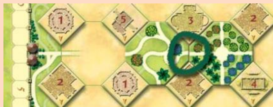
Helyesen úgy kell letenni a Kertlapokat, hogy már egy letett mellé kerüljön közvetlenül és illeszkedjen hozzá.

Minden további játékmenetben a Kertlapokat úgy kell lerakni, hogy az legalább egy már letett Kertlappal határos legyen. Ekkor már lehet a szélső sorokat és a sarkot is használni.